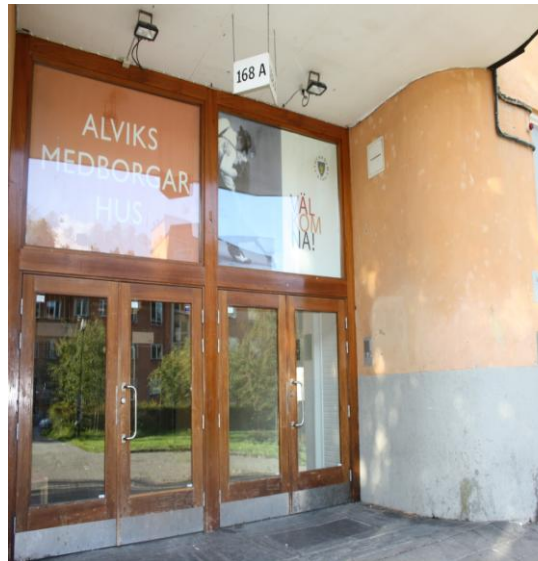
Entrén, Alviks Medborgarhus

Ett möte hölls den 3 juni 2010 där 23 föreningar deltog och en majoritet beslutade att en förening skulle bildas. Som föreningsnamn valdes Alviks Kulturhus och en interimstyrelse utsågs.