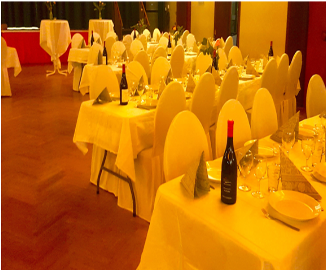
Festdukning i Brommasalen.

Den vackra Bromma-salen, en festsal i jugendstil med en 50 kvm stor al secco-målning samt reliefer runt salen av konstnären Axel Wallert utfördes i sam-band med att Alviks kommunal-hus byggdes åren 1939 -1941.